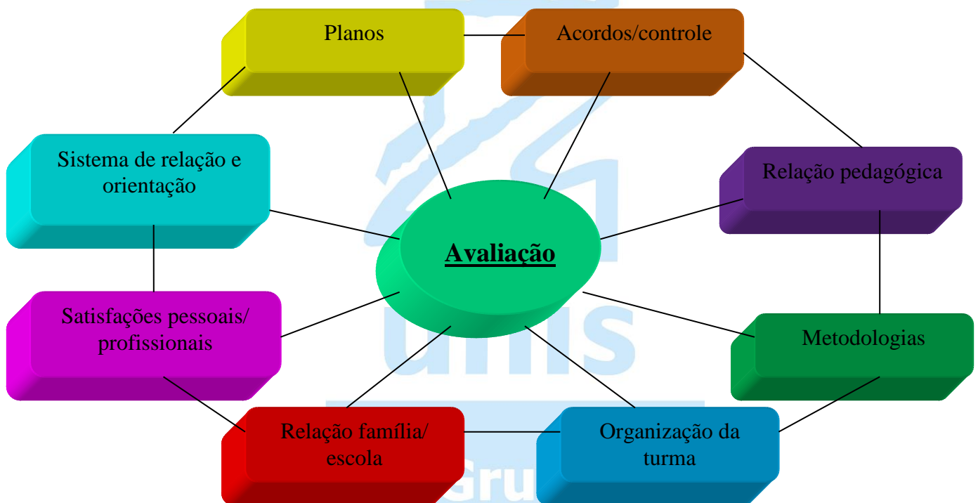
Figura 1. Octógono de Perrenoud (1999)

Ainda segundo Perrenoud (1999), a avaliação formativa corresponde a uma transformação muito grande na escola/academia. Trata-se de uma fase do processo avaliativo que ocorrerá apenas se planejada de forma sistêmica, ou seja levando em consideração a interdependência de todos os elementos, o que essencial para este tipo de processo. Para efeito didático, está ilustrado o enfoque sistêmico a que Perrenoud (1999) se refere abaixo, o octógono de avaliação de Perrenoud: